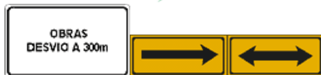
Figura 2 - Placas Fixadas em Postes.

Fonte: Manual de Elaboração de Projetos e Obras de Saneamento - (SOPS, 2005).