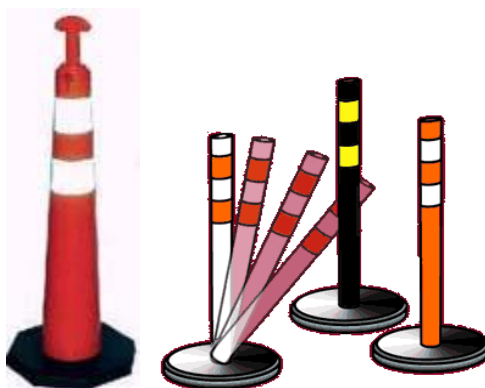
Figura 3 - Cones Balizadores.